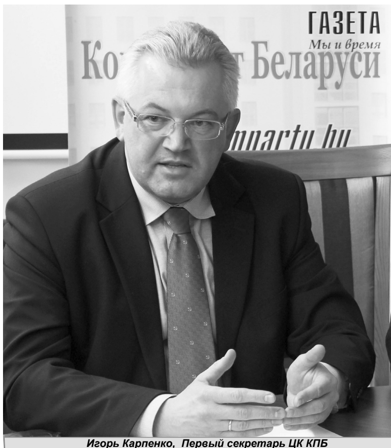
Игорь Карпенко, Первый секретарь ЦК КПБ

— Вы сказали, что успехи в восстановлении и развитии Белоруссии были достигнуты с помощью братских республик Советского Союза. Но не менее важно, думается, вспомнить и ту помощь, ко-