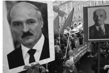
Александр Лукашенко 1 января 2014 года

Искренне желаю вам, дорогие соотечественники, крепкого здоровья, новых достижений, счастья и благополучия.