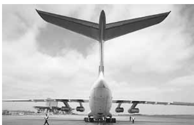
вообще и допуска ее к серийному производству образует экспериментальная авиация, которую планируется включить в состав Государственного военного промышленного комитета.

обусловлена развитием проектирования и изготовления беспилотных летательных аппаратов для нужд белорусских Минобороны и МЧС, а также народного хозяйства. Применение беспилотников в ряде случаев гораздо дешевле и безопаснее, чем использование самолетов и вертолетов», - пояснил он. Для проведения испытаний создаваемых беспилотных летательных аппаратов, новой техники