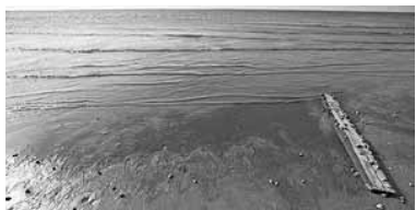
в идеальных условиях собрать всю нефть будет невозможно. На восстановление подводного мира потребуются годы.

Мировые автопроизводители надеются, что в 2013 году американский спрос компенсирует падение европейского рынка. Также снижаются продажи автомобилей в Японии, поэтому ставка на американский рынок становится еще более значимой.