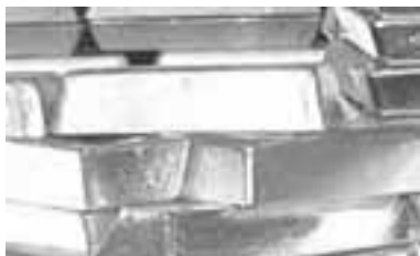
Золотой запас Нацбанка Беларуси исчисляется в тоннах и включает золото (91,5%), а также серебро, платину и палладий.

За 2012 год золотой запас Национального банка увеличился на 1,6 т и составил 33,3 т на 1 января 2013 года. В 2011 году золотой запас Национального банка Беларуси вырос на 400 кг.