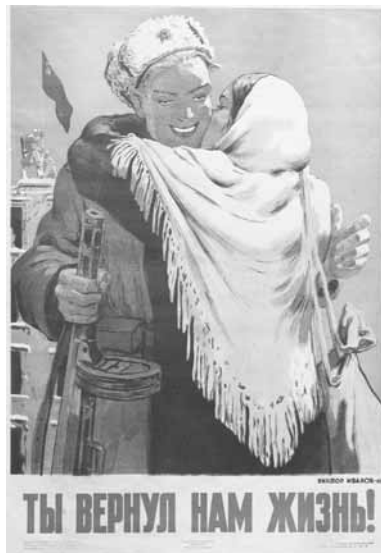
ТЫ ВЕРНУЛ НАМ ЖИЗНЬ!

В документе звучало предупреждение белорусского народа о смертельной угрозе со стороны отступавших фашистских войск, призыв всех трудящихся к актив-