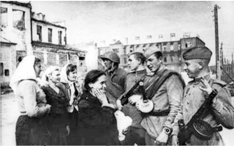
(Окончание на стр. 5) (Начало на стр. 4)

С этой целью по распоряжению Верховного Главнокомандования при военных советах фронтов создавались представительства и оперативные группы Белорусского штаба партизанского движения, которые должны были обеспечить оперативное управление партизанскими бригадами и отрядами, базировавшимися в полосе предстоящего наступления, согласовывать их боевые задачи с действиями регулярных советских войск. БШПД направил своих представителей в штабы Западного, Центрального и Калининского фронтов, установил контакты с командованием армейских объединений. Так, осенью 1943 года начальник БШПД П.З.Калинин, его заместители и другие ответственные лица побывали в воинских штабах, где ознакомили командование с расположением и боевыми возможностями партизанских отрядов и бригад, действовавших в Белоруссии в полосах наступления фронтов и армий, согласовали