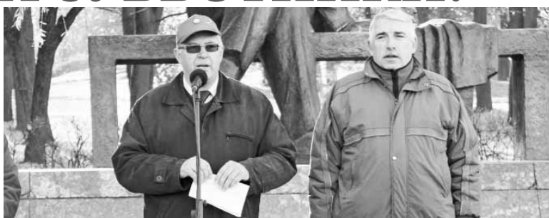
Секретарь ЦК КПБ Г.П.Атаманов на митинге в парке им.Горького

Более активно стартовало и озеленение города. С начала осеннего месячника по благоустройству работники «Минскзеленстроя» высадили 1,1 тыс. деревьев, 13,3 тыс. кустарников и 30 тыс. луковичных растений. Кроме того, очищена территория парков, скверов, бульваров и других зон площадью 3,200 га. В этих работах были задействованы более 12 тыс. зеленых строителей и добровольных помощников из политических партий, общественных организаций и трудовых коллективов.