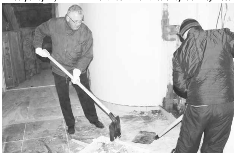
Первый секретарь ЦК КПБ И.В.Карпенко. «Чижовка-Арена»

Расслабляться не стоит и на предстоящих выходных. Месячник по уборке и благоустройству территорий проходит до 31 октября. И если каждый уделит этому важному делу хоть чуточку вре-