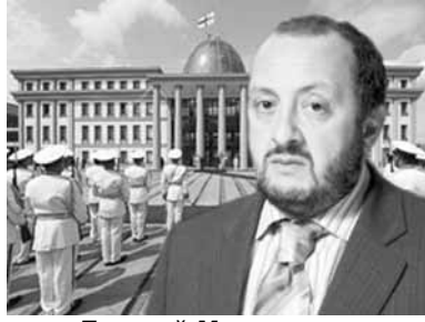
Георгий Маргвелашвили, новый президент Грузии

Оппозиционно настроенный электорат в большинстве сво-