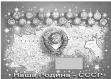
Наша Родина - СССР

Далее, весь машинно-тракторный парк, работавший в колхозах, входил в состав машинно-тракторных станций