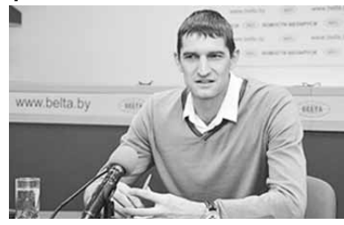
«Сегодня могу сказать лишь одно: я делаю все возможное для того, чтобы, проснувшись утром, быть стопроцентно готовым к участию в очередном турнире, находясь в лучшей физической форме».