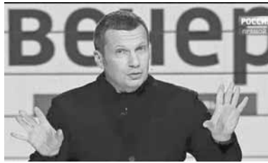
рые опомнились спустя 10 лет.

- Главная причина заключается в том, что информационно-пропагандистская машина была столь омерзительна, что она отравила многие души, и некото-