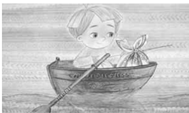
В этом году программа фестиваля включала 160 игровых, документальных и анимационных фильмов из 11 стран мира.

тетных проектов Комплексной целевой программы «Духовно-нравственная культура подрастающего поколения России». Киносмотр объединяет всех тех, кто стремится создавать фильмы о любви, верности, добрых человеческих отношениях, способных возвышать человека над реальностью, вселять надежду.