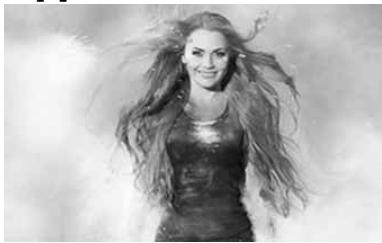
«Еurovision-2014» в Копенгагене (Дания).

Финал отбора пройдет в январе в формате телевизионного концерта. Исполнитель, набравший наибольшее количество баллов по результатам голосования профессионального жюри и зрительского голосования, станет победителем проекта и представит Беларусь на международном конкурсе песни