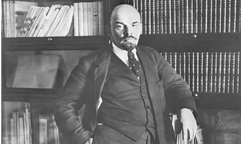
Владимир Ильич Ленин Маленькая, но боевая партия