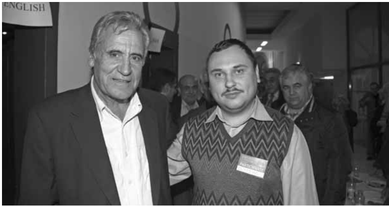
Секретарь ЦК КПБ Николай Волович и Генеральный секретарь Компартии Португалии Жерониму де Соуза

бочих партий мира, собравшихся на 15-ю международную встречу.