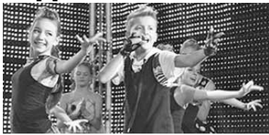
участника, диском с конкурсной песней.