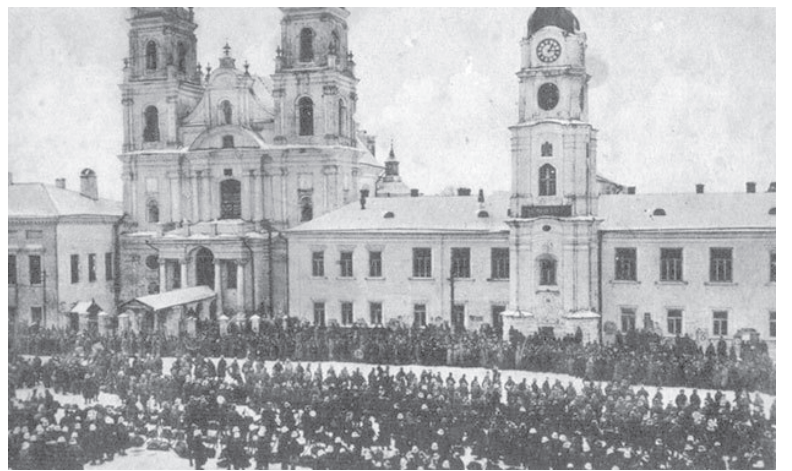
Вход немецких солдат в Минск. Февраль 1918 г.