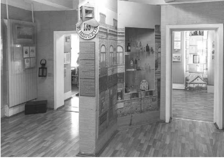
(Окончание, начало на стр.5)

Процесс создания целостной социал-демократической организации начался. Как написал впоследствии в книге «Первый съезд РСДРП» председатель съезда Б. Л. Эйдельман: «Задача групп, собравшихся на первый съезд, состояла в сплочении с.-д. элементов вокруг одного центра и в создании