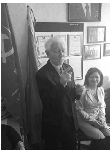
Состоялось заседание Ганцевичского районного комитета партии.

На повестке дня заседания был рассмотрен ряд вопросов. Среди основных – итоги работы Ганцевичского районного партийного комитета. С докладом перед собравшимися выступил Первый секретарь районного комитета. Были затронуты вопросы деятельности партийной организации, о развитии партийного движения, об увеличении численности и уровне охвата партийным членством. Также были всесторонне рассмотрены другие важные вопросы партийной деятельности. По итогам заседания был принят проект постановления. В настоящее время перед коммунистами стоит ряд задач, для выполнения которых следует принять меры