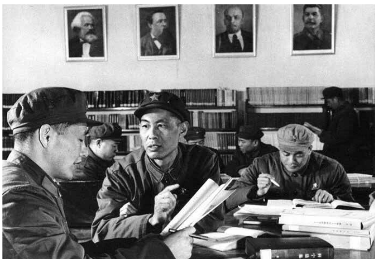
Политработники Народно-освободительной армии Китая штудируют классиков в Бюро переводов Маркса, Энгельса, Ленина и Сталина при ЦК КПК (2016 г.)

Китайское руководство по-прежнему (и небезуспешно) совмещает марксистскую доктрину со своими реформаторскими новшествами, умело приспособившая отдельные работы и высказывания всё тех же четырех классиков к идеологическим и экономическим требованиям в конкретные исторические периоды. Подобный подход оказывает позитивное воздействие на общественно-политическую ситуацию в стране.