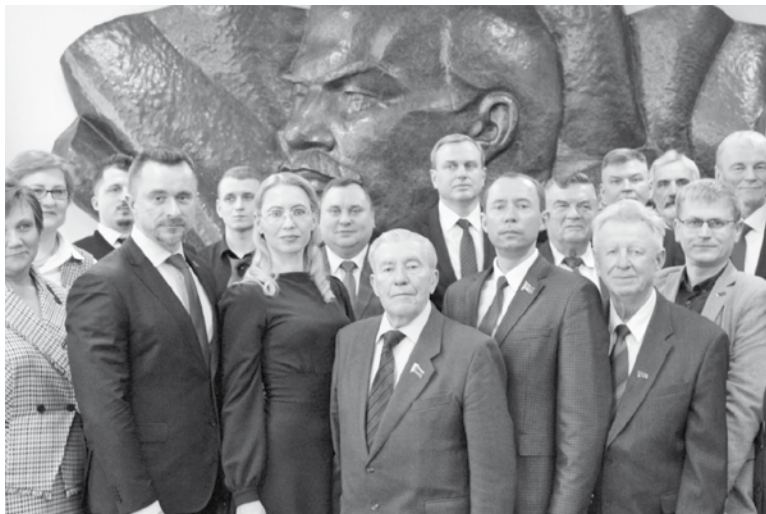
— Палаты представителей Национального собрания Республики Беларусь и местных Советов депутатов. ■

В Пленуме планируется участие членов Центрального Комитета и Центральной контрольно-ревизионной комиссии КПБ, представителей органов государственного управления, депутатов