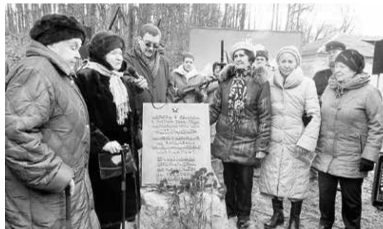
Былые узники интерната «Семково» вместе со связными партизанами бригады «Штурмовая».

лейтенант внутренней службы, белорусский писатель, участник боевых действий в Афганистане. В основу произведения положены рассказы очевидцев, а также документальные сведения и архивные материалы.