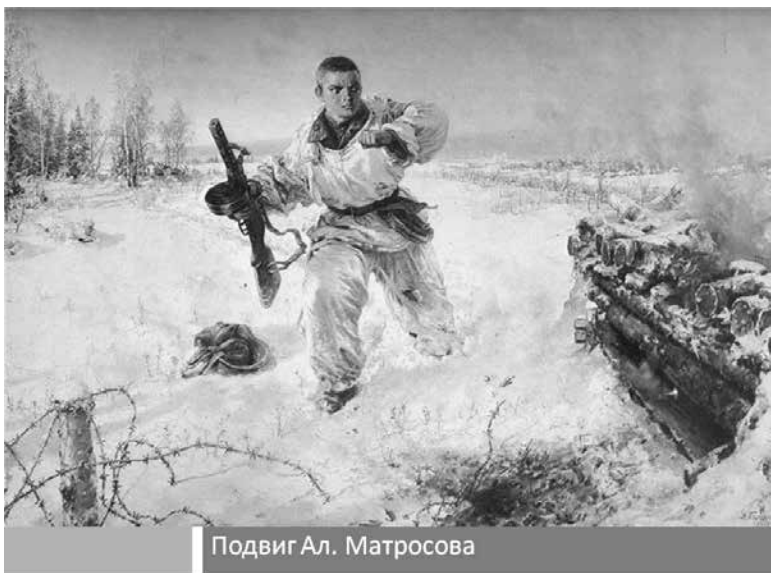
Подвиг Ал. Матросова

5 февраля 2024 года исполняется 100 лет со дня рождения гвардии рядового Александра Матросова, закрывшего в бою своим телом амбразуру вражеского дзота. Этот подвиг стал символом мужества и воинской доблести, бесстрашия и беззаветной любви к родному социалистическому Отечеству.