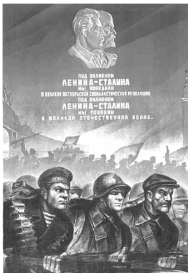
ВЫШЕ ЗНАМЯ ЛЕНИНА-СТАЛИНА ОНО НЕСЕТ НАМ ПОБЕДУ.

Великий праздник Победы «со слезами на глазах» бесконечно дорог белорусскому народу, который первый принял на себя вероломный удар фашистских захватчиков, как никто другой испытал всю тяжесть кровавой войны. Истерзанная, но непокорённая Беларусь, благодаря исключительному мужеству и самоотверженности воинов, партизан и подпольщиков, всего населения, превратилась в неприступную крепость, и вошла в историю как республика-партизанка. С первых дней Великой Отечественной войны боевой отряд и авангард миллионного ВЛКСМ – Ленинский Коммунистический Союз Молодёжи Белоруссии подчинил себя одной великой цели – защите социалистической Родины. Как отметил Президент Республики Беларусь А.Г. Лукашенко: «Мы живём под чистым небом. Во имя священной памяти героев Великой Отечественной войны обязаны сохранить мир и независимость своей земли. Передать эту самую большую ценность в нашей жизни следующим поколениям».