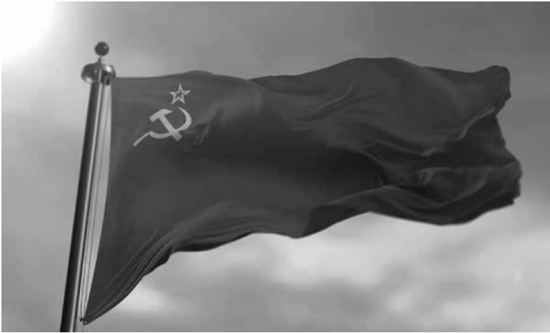
ГИМН СССР, 1977 год

слова М. МАТУСОВСКИЙ , музыка В. ШАИНСКИЙ