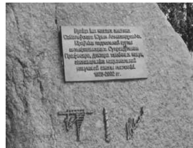
Памятный знак на улице, названной в честь Ю.А. Соболевского

Пройдут годы, хотим мы или не хотим, уйдут и наши имена, а дела останутся. Так пусть же они будут добрыми и полезными.