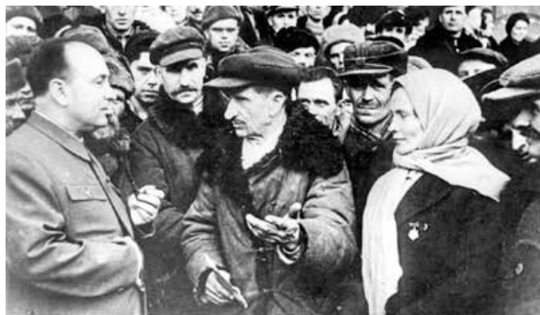
П.К. ПОНОМАРЕНКО встречается с населением Западной Белоруссии. Сентябрь, 1939 год.

В военный период П.К. Пономаренко входил последовательно в Военные советы Западного, Центрального, Брянского фронтов, а также 3-й Ударной армии и 1-го Белорусского фронта. В мае 1942 г. он становится руководителем Центрального штаба партизанского движения при Ставке Верховного Главнокомандования. Позже П.К. Пономаренко вспоминал, что при обсуждении кандидатуры начальника ЦШПД Сталин отметил: «Партизанское движение, партизанская борьба – это народное движение, народная борьба. И руководить этим движением, этой борьбой должна и будет партия и член ЦК ВКП(б). Сталин взял синий карандаш, обвёл стоявшую последней в представленном списке мою фамилию и стрелочкой поставил на первое место». Март 1943 г. был ознаменован для Пантелеймона Кондратьевича присвоением звания генерал-лейтенанта. В ходе партизанского движения 16 отрядов и 5 бригад только на территории Беларуси были названы именем П.К. Пономаренко. А всего за линией фронта на временно оккупированной врагом советской территории действовали