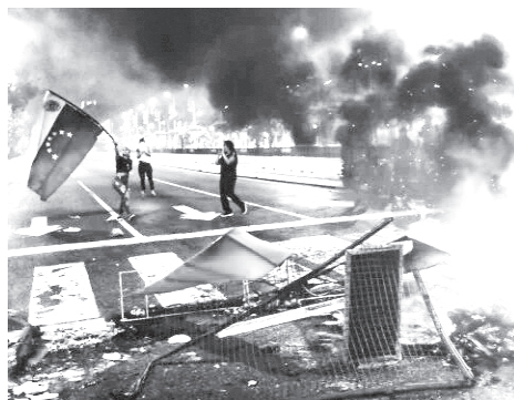
Беспорядки. Каракас, Венесуэла, 30.07.2024