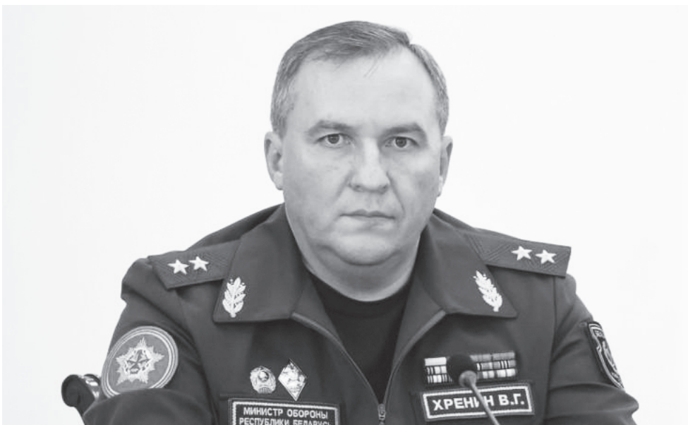
Министр обороны Республики Беларусь, генерал-лейтенант Виктор ХРЕНИН

«Мы расцениваем это как провокацию в отношении Республики Беларусь. Учитывая обстановку, складывающуюся в Украине, а также в Курской области России, Главнокомандующий Вооруженными Силами отдал указания на усиление группировки войск на Гомельском и Мозырском тактических направлениях с целью реагирования на любые возможные провокации. Воинские части сил специальных операций, сухопутных войск, ракетных войск, в том числе реактивные системы «Полонез» и комплексы «Искандер» получили задачи на совершение маршей в назначенные районы. Также осуществлено наращивание сил и средств ЗРВ, РТВ и авиации».