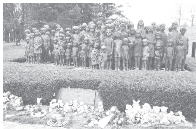
Мемориал на месте лагеря «Саласпилс»

Дети войны – наши последние свидетели тех страшных событий. Это поколение сегодняшних дедушек и бабушек, у которых не было времени на игры, они выросли буквально по минутам. Нам, тем, кто родился после войны, многого уже не понять, и того, что пережили эти дети – не пережить. Но мы можем читать рассказы тех, кто выжил, чтобы не только почувствовать, что они пережили, но и сохранить это в памяти, отдать дань бесконечного уважения и вечной благодарности.