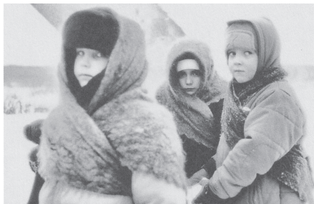
Дети блокадного Ленинграда

Они провожали своих отцов на войну и ждали весточки с фронта. С надеждой вглядывались в горизонт и в лица взрослых, не замечая, что и сами за несколько дней или месяцев повзрослели на десятки