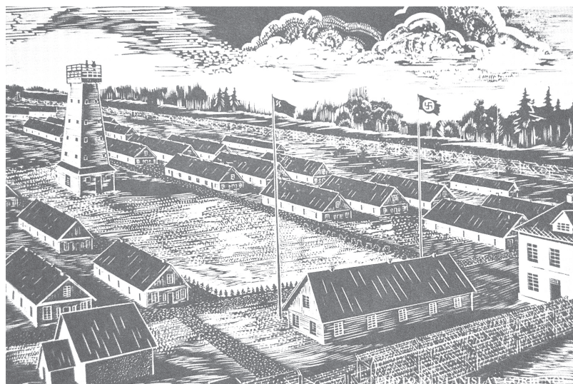
Рисунок узника лагеря

«Первая книга, которую мне удалось напечатать, называется «Дети войны: суворовцы вспоминают». В книгу вошло 43 воспоминания бывших малолетних узников, которые попали в суворовское училище. В нем воспитывались и до сих пор воспитываются патриоты. Выступая перед детьми, я широко использовал эту книгу и понял, что она является инструментом для проведения мероприя-