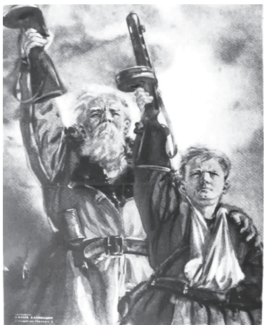
КЛЯНЕМСЯ МСТИТЬ ГИТЛЕРОВСКИМ ЗАХВАТЧИКАМ !