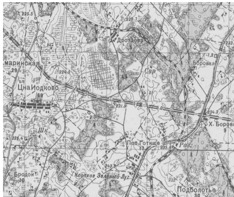
Фрагмент советской карты 1933 года

Первая составляющая куропатского фейка относится к определению места нахождения самих Куропат. Для начала разберёмся, о каком месте идет речь в приведённом выше тексте. Исходным ориентиром для анализа служит фраза: «...два километра на север от деревни...» (Зелёный Луг). В 1988 году, на момент публикации