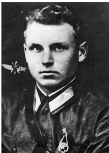
«Воздушный бой над Курской дугой»

Восемьдесят лет назад отгрохотали залпы одного из решающих сражений Великой Отечественной войны – битвы на Курской дуге (5.07. – 23.08.1943 г.), положившей начало деградации германских войск, окончательно утративших наступательный потенциал. В Курской битве проявился массовый героизм советских воинов, которые отличались стойкостью, мужеством, отвагой в бою, совершали бессмертные подвиги. Об одном таком подвиге лётчика-коммуниста рассказывается в подготовленном и изданном ограниченным тиражом двухтомнике «Легендарные первопроходцы». Ниже публикуем фрагмент книги.