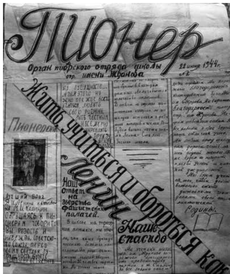
Стенгазета «Пионер» пионерского отряда школы партизанского отряда имени А.Жданова.

В Белорусском государственном музее истории Великой Отечественной войны воссоздан элемент лесной партизанской школы, где хранится отчёт о воспитательной работе среди детей школьного возраста 4-го семейного лагеря отряда за июнь 1944 г. В отчёте указывается, что «в семейном лагере школу посещают 46 детей, из них 1-го класса – 24, 2-го класса – 13, 3-го класса – 9 человек. На уроках изучаются следующие предметы: русский язык, арифметика, пение. Ребята выучили наизусть стихотворения «Взвилась ракета боевая», «Ведут народы бой», «Наша славная земля». Во внеурочное время проведены беседы «О действиях партизан», «О помощи населения партизанам», «О героических действиях партизанки Тани». По физкультуре во 2-м и 3-м классах изучены темы «Построение в шеренгу и колонну», «Повороты на месте и в движении», «Выход из строя». Кроме того, с детьми проведены занятия по бегу на короткие дистанции, прыжкам