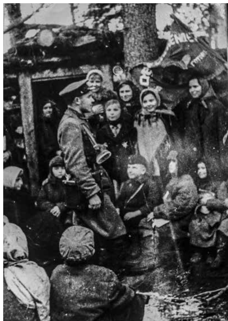
Урок в лесной школе ведёт партизанский командир.