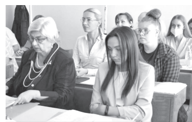
Президент Республики Беларусь Александр Лукашенко 7 июня 2021 г.

17 сентября будет отмечаться государственный праздник: День народного единства. Соответствующий Указ №206 подписал