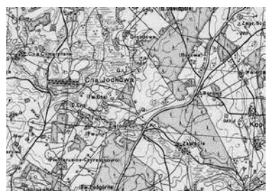
Польская карта 1933 г.

– Название «Куропаты» к лесу Брод не имеет никакого отношения. В Куропатах до войны леса уже не было, его вырубил раньше, выкорчевали пни, а поле распахали. Естественно, расстрелов в этом месте не могло быть. В статье «Куропаты – дорога смерти»