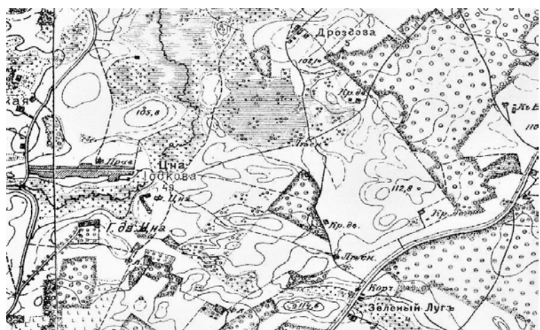
Фрагмент карты 1908 г.