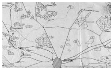
Фрагмент схемы расположения лесов Минского лесхоза

Отсутствие в Куропатах перед войной «старого бору» подтверждает и схема расположения лесов Минского лесхоза. Это не просто схема всех лесничеств, а наглядный документ учёта лесных угодий. Каждый пронумерованный в ней участок леса имел своё описание, исходя из которого проводилось планирование выделения древесины для нужд народного хозяйства, доводились нормы вырубке тому или оному лесничеству. Тот факт, что на схеме не обозначен лесной массив в так называемых Куропатах, указывает, что на этом месте вся промышленная древесина уже была вырублена,