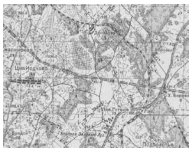
Фрагмент советской карты 1933 г.

Соответственно, в начале 30-х годов, приблизительно с 1933 года, никакого «старого бору» здесь уже не было! Обозначенный на Куропатском холме лес по состоянию на 1933 год в основном представлял из