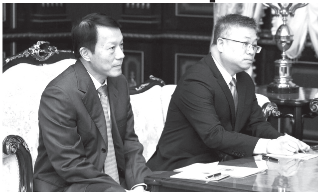
Президент Беларуси Александр Лукашенко 9 сентября провел встречу с Министром общественной безопасности Вьетнама Лыонг Там Куангом.

Глава государства прежде всего поздравил гостя с Днем Независимости Вьетнама, который отмечается в республике 2 сентября. «Этот праздник вьетнамцы заслужили потом и кровью, они за него боролись. И это быстро развивающаяся не только в Азии, но и в мире, состоявшаяся страна», – подчеркнул Александр Лукашенко.