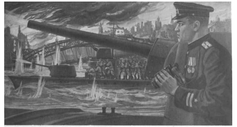
СЛАВА ГЕРОИЧЕСКИМ МОРЯКАМ КРАСНОЗНАМЕННОЙ ДНЕПРОВСКОЙ ФЛОТИЛИИ

Корабли без единого выстрела и незамеченные противником рано утром высадили в центре Пинска первый эшелон десанта в составе бойцов и техники 1326-го полка 415-й стрелковой дивизии и отряда моряков. Высадка была произведена непосредственно на причалы порта города и настолько неожиданно, что гитлеровцы не смогли оказать сопротивления. Десантники действовали решительно и быстро, под их стремительным натиском немцы откатывались к центральным