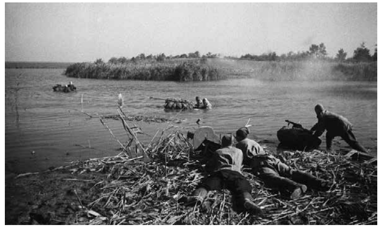
Бойцы ведут бой на Днепре, осень 1943 г.

Вступление Красной Армии на территорию БССР и развёртывание военных действий по освобождению белорусской земли от немецко-фашистского ига мобилизовали белорусский народ, многочисленные партизанские силы для ещё более активной поддержки наступающих соединений и частей Красной Армии. На это нацеливало «Обращение Президиума Верховного Совета Белорусской ССР, Совета