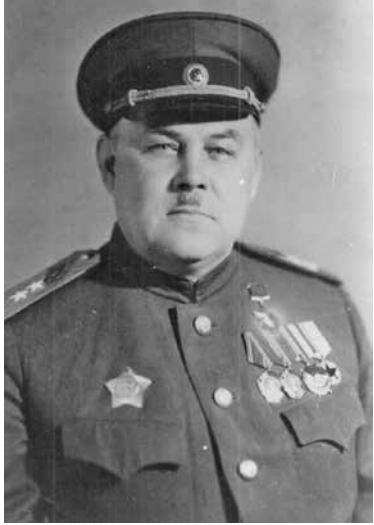
Генерал-лейтенант Н.П. Пухов

В Год исторической памяти мы с гордостью вспоминаем, как 79 лет назад, 23 сентября 1943 г., советскими войсками был освобождён от немецко-фашистских захватчиков первый населённый пункт Беларуси – районный центр Комарин Полесской (Гомельской) области. С этого дня начался долгий и трудный путь изгнания вражеских оккупантов с героической и непокорённой белорусской земли.