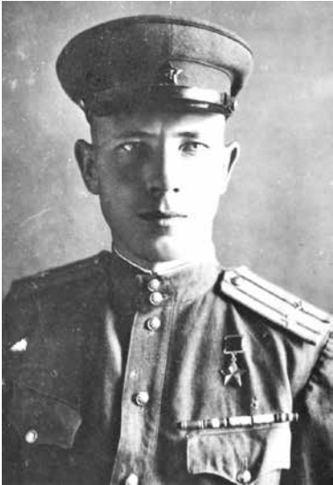
Герой Советского Союза Н.И. Сташек

В этот период белорусскими партизанами было взорвано более 90 тысяч рельсов, свыше 1 тысячи эшелонов, разрушено