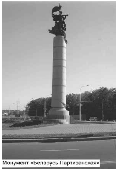
Монумент «Беларусь Партизанская»