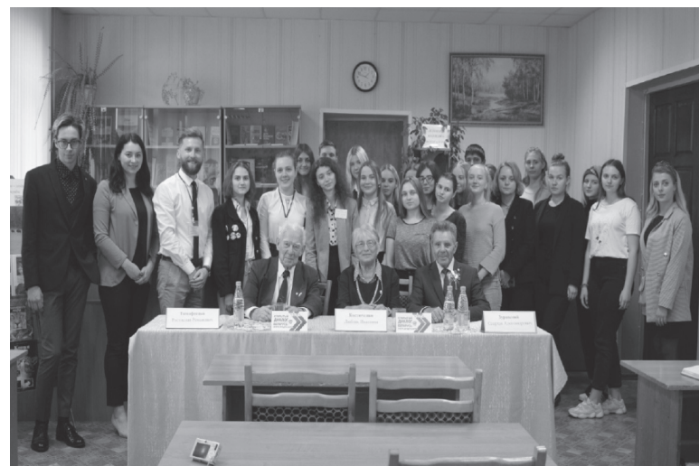
педагогический колледж имени Л. С. Выготского».

В холле колледжа была представлена выставка, посвященная 100-летию ЛКСМ, организованная учреждением образования «Гомельский государственный