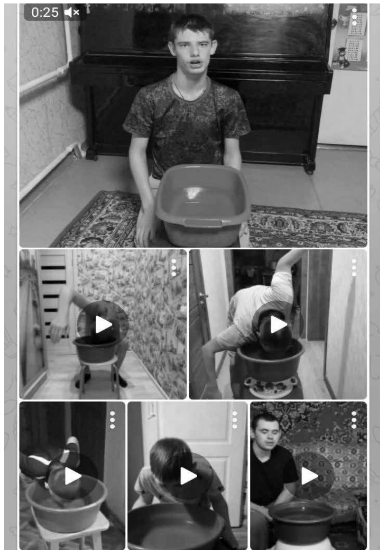
И снова о наших любимых Дельфинчиках и о воде.