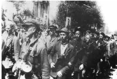
Партизанский полк «Тринадцать»