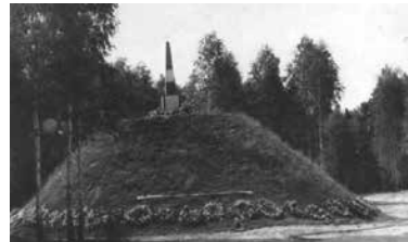
Курган Бессмертия д.Добужа