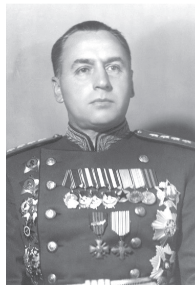
Генерал армии Алексей Иннокентьевич Антонов (15.09.1896 – 18.06.1962 гг.). Кавалер: ордена «Победа»;

Всего было сделано 30 таких орденов, но их обладателями стали только 17 человек. Все они являлись главами государств или маршалами. Среди них А.И. Антонов оказался единственным