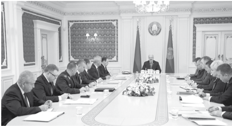
Президент Беларуси Александр Лукашенко собрал совещание с руководством Совета Министров, на которое вынесены разноплановые вопросы.

«Несмотря на то, что они разноплановые, их объединяет одно - нацеленность на решение актуальных проблем жизни нашего общества», - подчеркнул белорусский лидер.