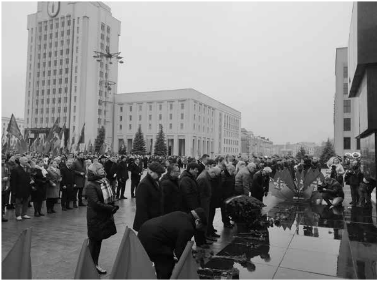
(Окончание, начало на стр.1)

А, значит, остановить сползание современного мира к глобальной войне можно только одним единственным способом – возрождением на социалистической основе Союза наших братских народов и всех, кто захочет быть рядом.