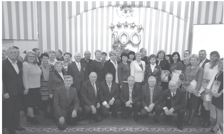
Представители Мозырского РК КПБ, ветераны местной комсомольской организации, члены БРСМ, меценаты приняли участие в торжественном открытии.

Осень 2018 года была богата на события, приуроченные к 100-летию ВЛКСМ. И в череде мероприятий, акций, концертов и поздравлений особое место заняли те проекты, результат которых останется «на века». Один из них – открытие музея истории Мозырского комсомола в средней школе №12.