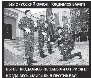
БЕЛОРУССКИЙ ОМОН, ГОРДИМСЯ ВАМИ! ВЫ НЕ ПРОДАЛИСЬ, НЕ ЗАБЫЛИ О ПРИСЯГЕ! КОГДА ВСЁ «МИР» БЫЛ ПРОТИВ ВАС!