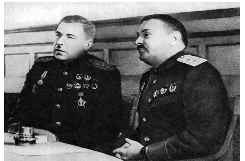
Л.А. Говоров и А.А. Жданов, январь 1943 г.

Германское командование сильно укрепило шлиссельбургско-синявинский выступ: передний край обороны прикрывала густая сеть проволочных заграждений, минных полей и других противотанковых и противопехотных препятствий и простреливался артиллерийскими орудиями и пулеметами. Вдоль левого берега Невы тянулись две-три линии траншей, соединявшиеся ходами с многочисленными дотами. Все поселки, находившиеся в этом районе, были превращены врагом в сильные опорные пункты. Оборона противника опиралась к тому же на весьма выгодные высоты и другие