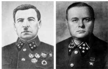
Генерал-лейтенант Л. А. Говоров Генерал армии К. А. Мерецков

плацдарма на Ропшу и Красное Село. Одновременно советские войска стремительно наступали в районе Новгорода и 20 января освободили этот древний город. К 27 января 1944 г. войска Ленинградского и Волховского фронтов сломали оборону 18-й немецкой армии, разгромили её основные силы и продвинулись на 60 км в глубину. Из приказа Военного совета Ленинградского фронта 27 января 1944 г.: «В итоге боёв решена задача исторической важности: город Ленинград полностью освобождён от вражеской блокады и от варварских артиллерийских обстрелов противника... Граждане Ленинграда! Мужественные и стойкие ленинградцы! Вместе с войсками Ленинградского фронта вы отстояли наш родной город. Своим героическим трудом и стальной выдержкой, преодолевая все трудности и мучения блокады, вы ковали оружие победы над врагом, отакая для дела победы все свои силы».