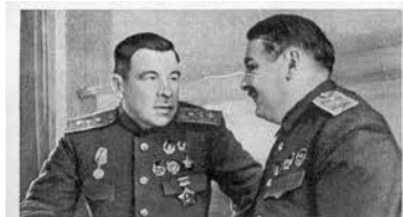
Руководители обороны Ленинграда генерал-полковник Л. А. Говоров и генерал-лейтенант К. А. Мерецков

ПВО (всего 1386 самолетов). К участию в операции привлекались также партизаны – 13 бригад, всего 35 тыс. человек. Как отмечал в своих мемуарах «На службе народу» генерал К.А. Мерецков: «В Ленинградской области действовали многие тысячи партизан. Большая часть их находилась в составе четырёх бригад и одного полка. Они поддерживали постоянный