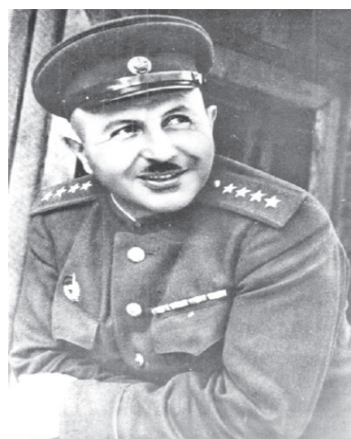
Командующий 1-м Прибалтийским фронтом генерал армии Иван Христофорович БАГРАМЯН.

В мемуарах «Так шли мы к Победе» Маршал Советского Союза И.Х. Баграмян отмечал, что при назначении его должность командующим 1-м Прибалтийским фронтом Верховный Главнокомандующий И.В. Сталин отметил: «Мы решили передать одиннадцатую гвардейскую армию в состав войск Первого Прибалтийского фронта и возложить на вас задачу разгромить городокскую группировку войск противника и в последующем овладеть Витебском». По словам Иосифа Виссарионовича, здесь «...необходимо было изолировать две оперативно-стратегические группировки врага – северную и центральную, открыть себе ворота и создать выгодные условия для освобождения всей Белоруссии».