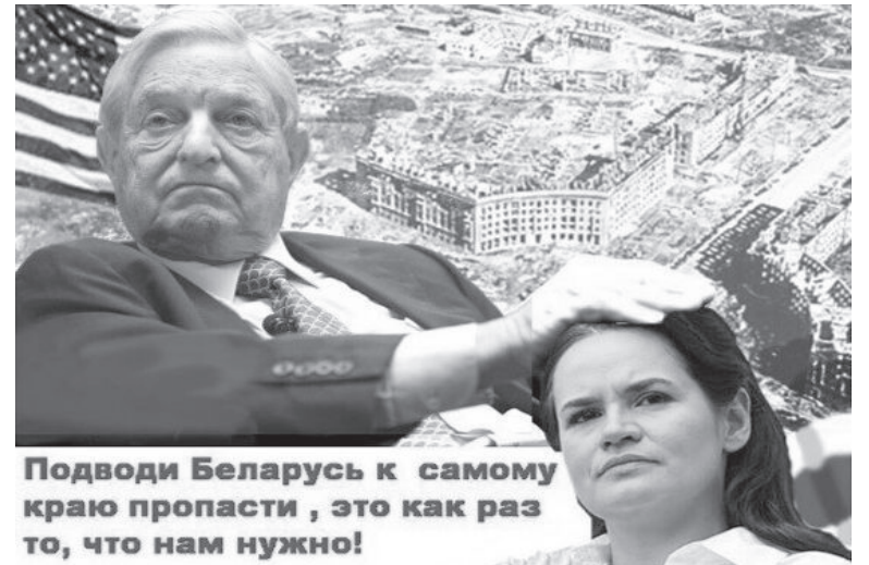
Подводи Беларусь к самому краю пропасти, это как раз то, что нам нужно!

поставлено перед глобальным вызовом. Эпоха постправды и фейк-ньюс разрушает классические нормы и принципы профессиональной журналистики. Превращает информационное медиaprостранство в поле боя геополитических интересов, в центре которых находится и Беларусь», – отметил А. Лукашенко в приветствии делегатам и участникам XIV съезда Белорусского союза журналистов.