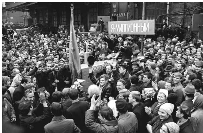
1972. 5 ноября 1972 с конвейера Минского тракторного завода сошла миллионная машина

противоречий, предопределивших революционную ситуацию в России, слом старого порядка не был безболезненным. Монархические и буржуазные силы не могли «управлять по-новому», но и не хотели отступать под напором действующих осознанно революционных масс рабочих, крестьян, солдат и прогрессивной интеллигенции, которые не хотели «жить по-старому». Однако гражданская война, разруха и иностранная интервенция, причем не только со стороны главных