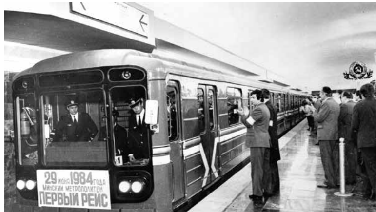
1984. Открытие первой очереди Минского метрополитена от станции «Институт Культуры» до станции «Московская». От перрона станции «Площадь Ленина» отходит подземный экспресс

реализовать социально-ориентированный курс.