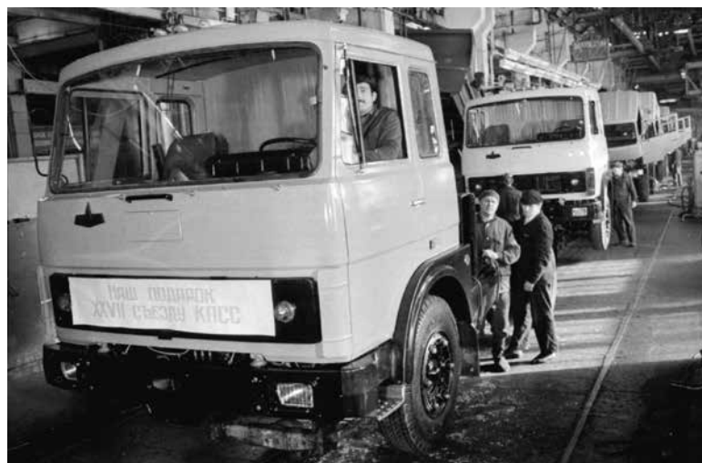
1986. Минский автомобильный завод. Первые серийные автомобили МАЗ-6422 на конвейере

Поэтому я считаю распад Советского Союза как своей