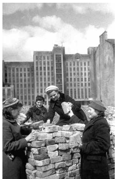
1944. Минчане на восстановлении площади имени В.И. Ленина

Наши нынешние успехи в здравоохранении уходят своими корнями в советскую эпоху, когда были заложены основы высокого уровня подготовки медицинских работников, сформировались этические нормы и традиции миссионерского отношения к пациентам. Тогда – спасти человека, даже если операция проводится в партизанской