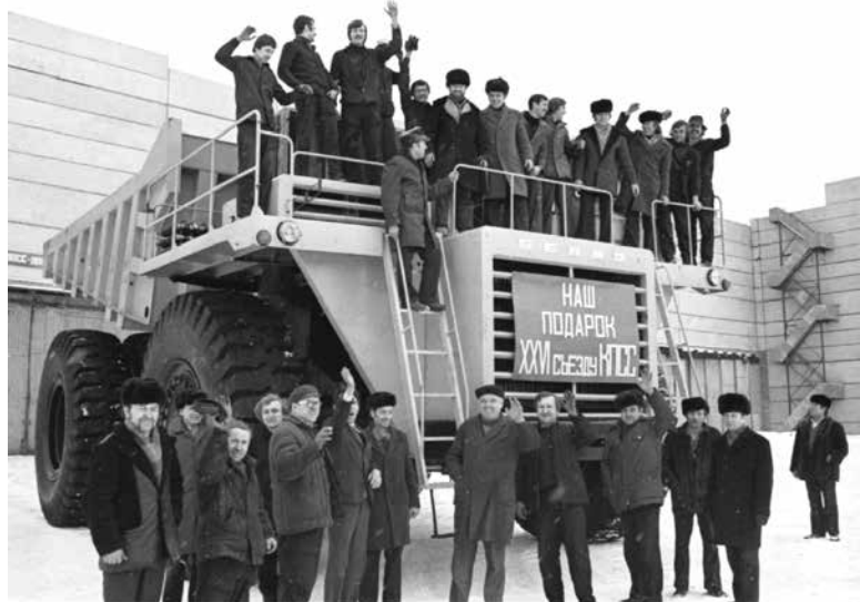
1981. Белорусский автомобильный завод в Жодино. Первый серийный 110-тонный самосвал изготовлен на Белорусском автомобильном заводе в Жодино. Машиностроители посвятили это трудовое достижение XXVI Съезду КПСС

мультидиапазонные радиоприемники VEF и усилители Radiotekhnika.