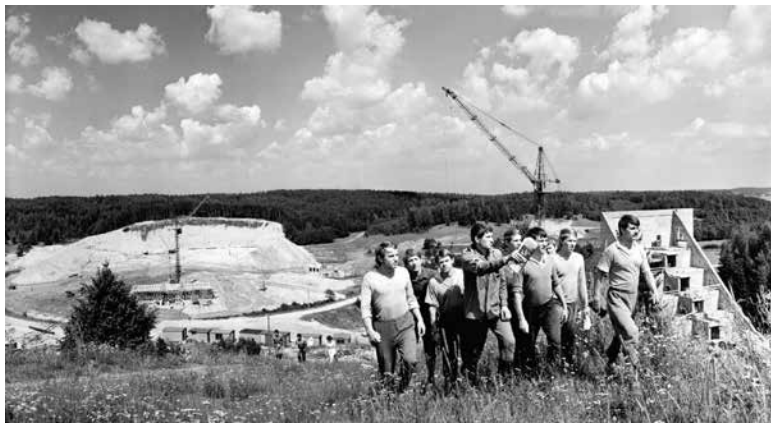
1973. Строительство специального комплекса для проведения чемпионата мира по биатлону в окрестностях д. Раубичи. На стройке работает студенческий отряд «Биатлон»

Рисковать своей жизнью, если так требуют обстоятельства, но выполнить долг до конца. Как