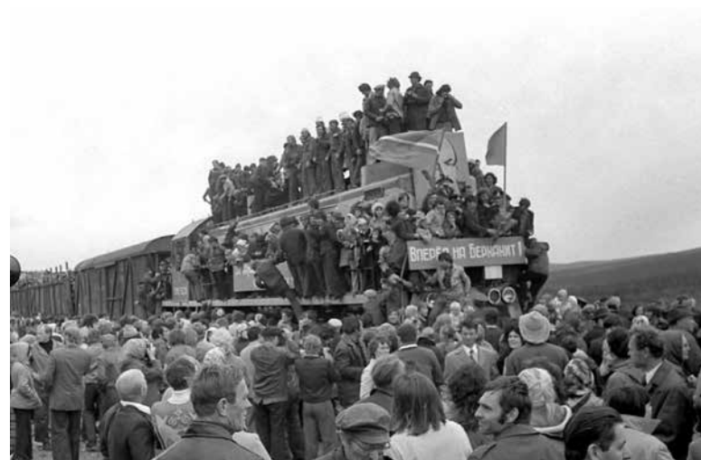
1977. Белорусский строительный отряд на БАМе. Первый белорусский комсомольско-молодежный отряд строителей БАМа имени Николая Кедышко. Строители едут по дороге, построенной своими руками

шагом, не сомневаюсь, будет стремление приравнять СССР к фашистскому блоку. Конъюнктурно подобранные «факты» под этот «вывод», такие как голодомор, уже накапливаются.