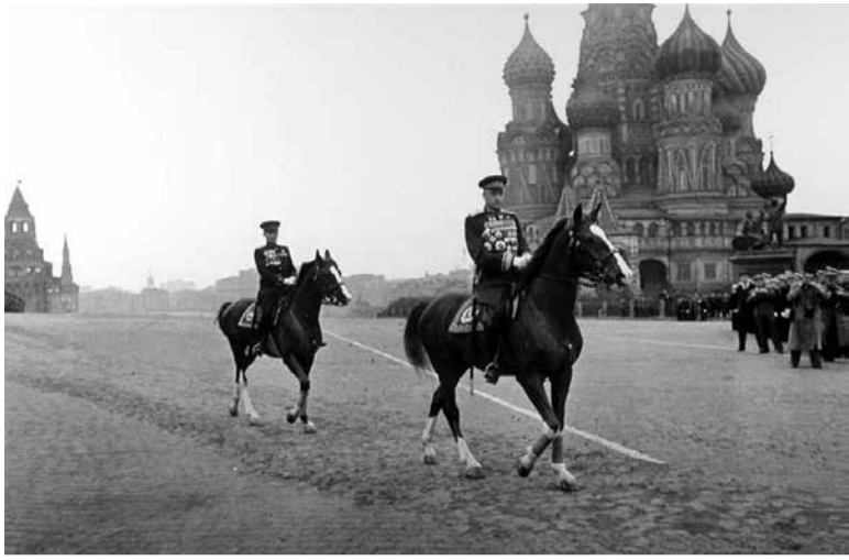
В нашу честь гремел не раз. Храбрый маршал Рокоссовский Вел всегда к победе нас!

Наступил 1945-й победный год. Командуя войсками 2-го Белорусского фронта, Рокоссовский провел три основные наступательные операции: Восточно-Прусскую, Померанскую и Одерскую. 31 марта 1945 г. маршал Рокоссовский одним из первых среди советских военачальников был награжден орденом «Победа», а 2 мая 1945 г. второй раз удостоен звания Героя Советского Союза.