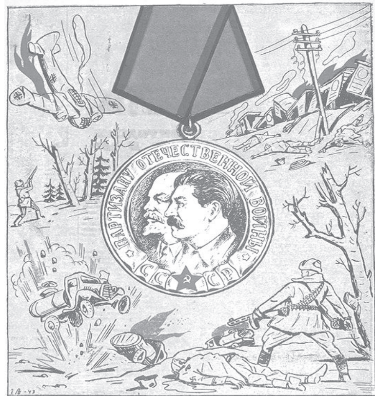
Тым слава, хто ёсца аддана, Хто ўсёе чужыннымі шлях,