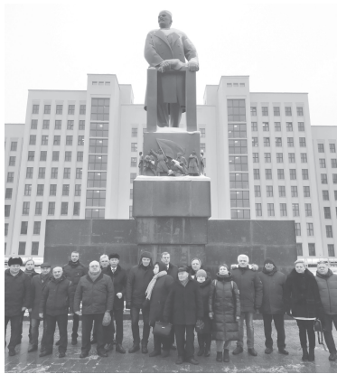
На мероприятии присутствовали первый секретарь Минского городского комитета КПБ В.Г.

21 января 2021 столичный актив компартии Беларуси, секретари ЦК КПБ, депутаты Палаты представителей от Коммунистической партии Беларуси возложили цветы к памятнику Владимиру Ильичу Ленину на площади Независимости в Минске.