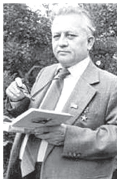
перед известным писателем-коммунистом.

Какое бы ни вкладывалось значение в определение «профессиональный писатель», Иван Петрович Шамякин, несомненно, им был. Жить для него – значило писать, и он творил до последнего дня своего. Так, как велел ему партийный и гражданский долг настоящего патриота родной Беларуси. Вношу предложение Минскому горкому Компартии Беларуси совместно с коммунистами первичной партийной парламентской организацией провести в 2021 году занятие в школе партийного актива «Коммунист, депутат, патриот Отечества Иван Шамякин». А в первичных парторганизациях республики провести на эту тему информирование коммунистов. Это будет наш посильный партийный долг