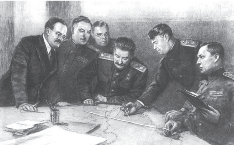
И.В. Сталин, В.М. Молотов, К.Е. Ворошилов, А.С. Щербаков, А.М. Василевский, К.К. Рокоссовский за разработкой плана окружения армий Паулюса в районе Сталинграда (с рисунка художника К.И. Финогенова)

С коммунистическим приветом, Центральный Комитет, Совет КПБ