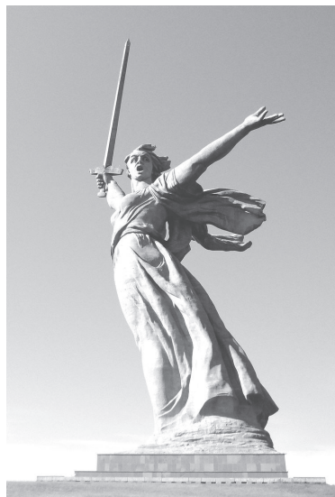
человек под Сталинградом».

Хотелось бы ответить им словами Верховного Главнокомандующего И.В. Сталина, который писал: «Не может быть сомнения, что только правильная стратегия командования Красной Армии и гибкая тактика наших командиров-исполнителей могли привести к такому выдающемуся факту, как окружение и ликвидация огромной отборной армии немцев в составе 330 тысяч