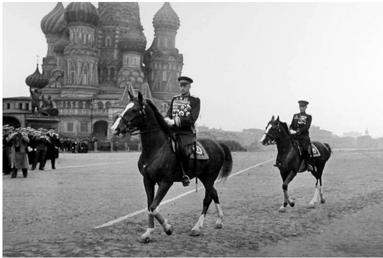
Маршал К.К. Рокоссовский командует Парадом Победы в Москве, 24 июня 1945 г.