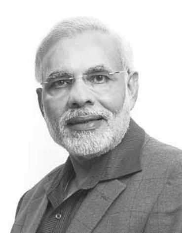
Нарендра Моди, Бхаратия джаната парти

Локомотивом предвыборной кампании БДП стал ее лидер — 63-летний Нарендра Моди, харизматичный политик, умело использующий предрассудки электората. Выступив в образе выходца из низов, всего добившегося своим трудом, Моди выгодно отличался от своего главного конкурента — вице-президента ИНК Рахула Ганди. Последний в глазах индийцев является рафинированным элитарием, которому власть досталась по наследству (Рахул является сыном Раджива и внуком Индиры Ганди). В заслугу Моди ставились реальные дела. Больше десяти лет он возглавлял западный штат Гуджарат и добился бурного экономического роста региона (правда, оппоненты обвиняли Моди в том, что он разрешил инвесторам нарушать