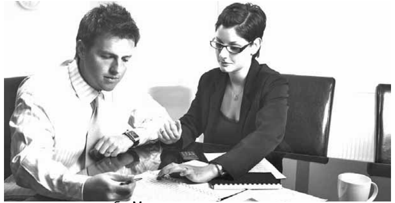
тили в пресс-службе Минэкономики.

постоянной площадкой для организации процессов ГЧП и координирования сотрудничества представителей министерств, государственных органов, частного бизнеса, банковского и финансового сектора, научного и академического сообщества и общественных организаций в целях реализации инфраструктурных проектов на принципах государственно-частного партнерства», — отме-