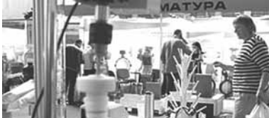
замглавы ведомства, в течение

компаний Минэнерго. Нам удалось найти согласованные решения по реализации отдельных проектов. По словам первого