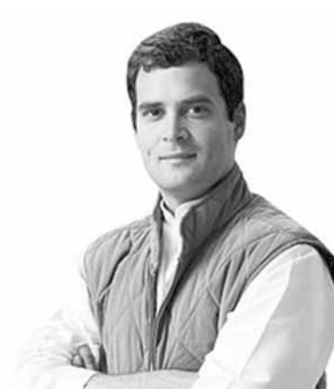
Рахул Ганди, Индийский национальный конгресс

Что же послужило причиной падения популярности левых сил? В 2004 г. ИНК, чтобы сформировать правительство, пошел на союз с левыми. Компартия Индии (марксистской) досталась пост спикера парламента, а также несколько постов в правительстве. Однако быстрое разочарование населения в политике Конгресса затронуло и коммунистов. Несмотря на то, что левые открыто критиковали правительство (например, выступив против «ядерной сделки») и на последние выборы шли под лозунгом «Оттеснить Конгресс, разбить