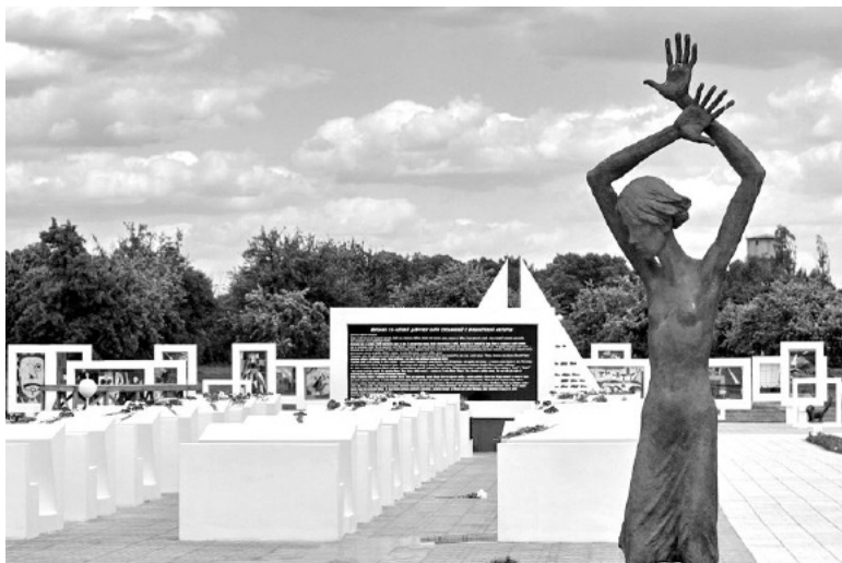
(Окончание, начало на стр.5)