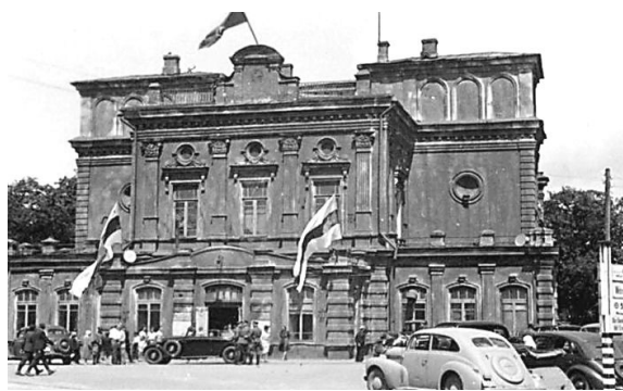
Бело-красно-белый флаг над Национальным академическим театром в оккупированном Минске. 1943 год