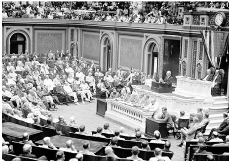
Президент Вильсон выступает перед Конгрессом

21 февраля 1918 г. Д.Френсис». Некоторое время спустя посол США в России Френсис, он же крупнейший банкир и хлеботорговец, вновь пишет Лансину, что единственным путем быстро покончить с властью Советов «является немедленное занятие союзниками Петрограда и Москвы путем послышки, без всяких оттяжек. Достаточного количества войск в Мурманск и Архангельск».