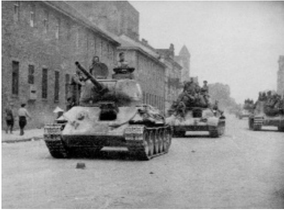
Части Красной Армии входят в Минск. Июль 1944 г.

Летом 1944 г. в результате наступления Красной Армии в ходе Белорусской стратегической операции «Багра-тион» немецкие войска оказались в катастрофическом положении. Их оборона была сокрушена на всех направлениях, от Западной Двины до Припяти. Пали ключевые позиции противника под Витебском, Оршей, Могилевом и Бобруйском. Советские войска освободили десятки городов и тысячи деревень республики. С мощным ударом советских соединений и частей слились ощутимые удары по врагу белорусских партизан.