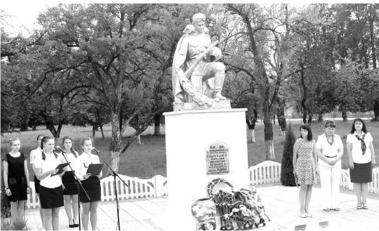
достоинство — силой его патриотизма.» (Н.Г.Чернышевский)

Таким образом, Ивьевская районная организация Коммунистической партии Беларуси отдала дань памяти героям Великой Отечественной войны, пожертвовавшим своими жизнями ради нашего светлого будущего, и акцентировала внимание жителей района, в первую очередь — молодежи, на особую актуальность патриотического воспитания. «Историческое значение каждого русского человека измеряется его заслугами Родине, его человеческое