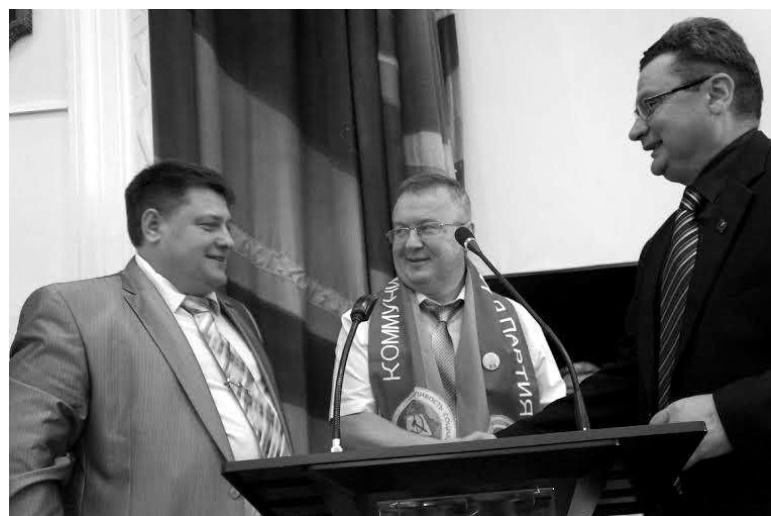
«Добро вернём, и жизнь избирательной кампании 2016 наладим!» - лозунг коммунистов Псковской области в